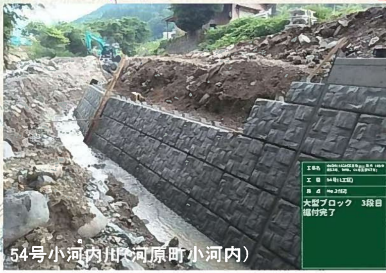
54号小河内川(河原町小河内)

工事名 河川改修工事 工種 土木(土工) 期日 令和5年 大型ブロック 3段目 撤付完了