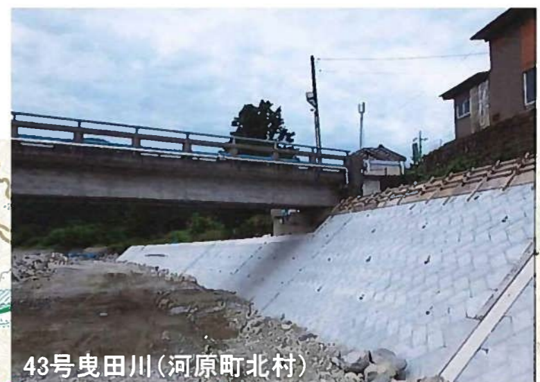
43号曳田川(河原町北村)