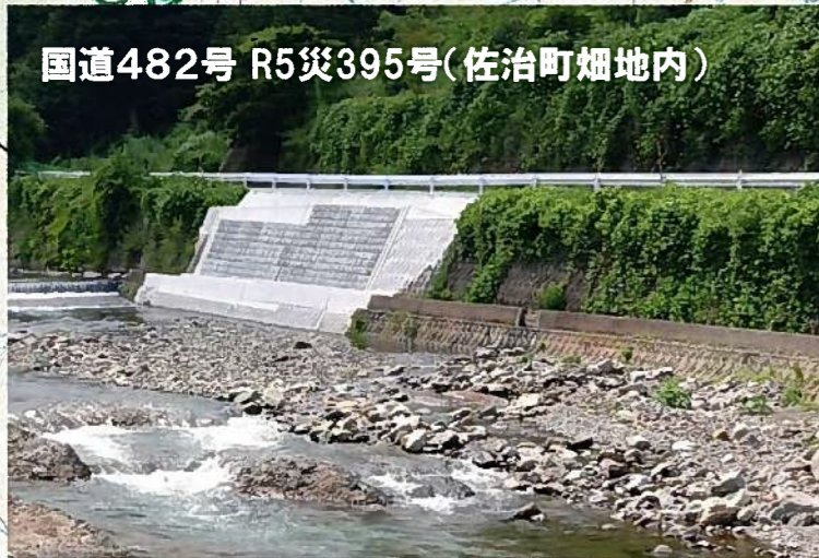
国道482号 R5災395号(佐治町畑地内)