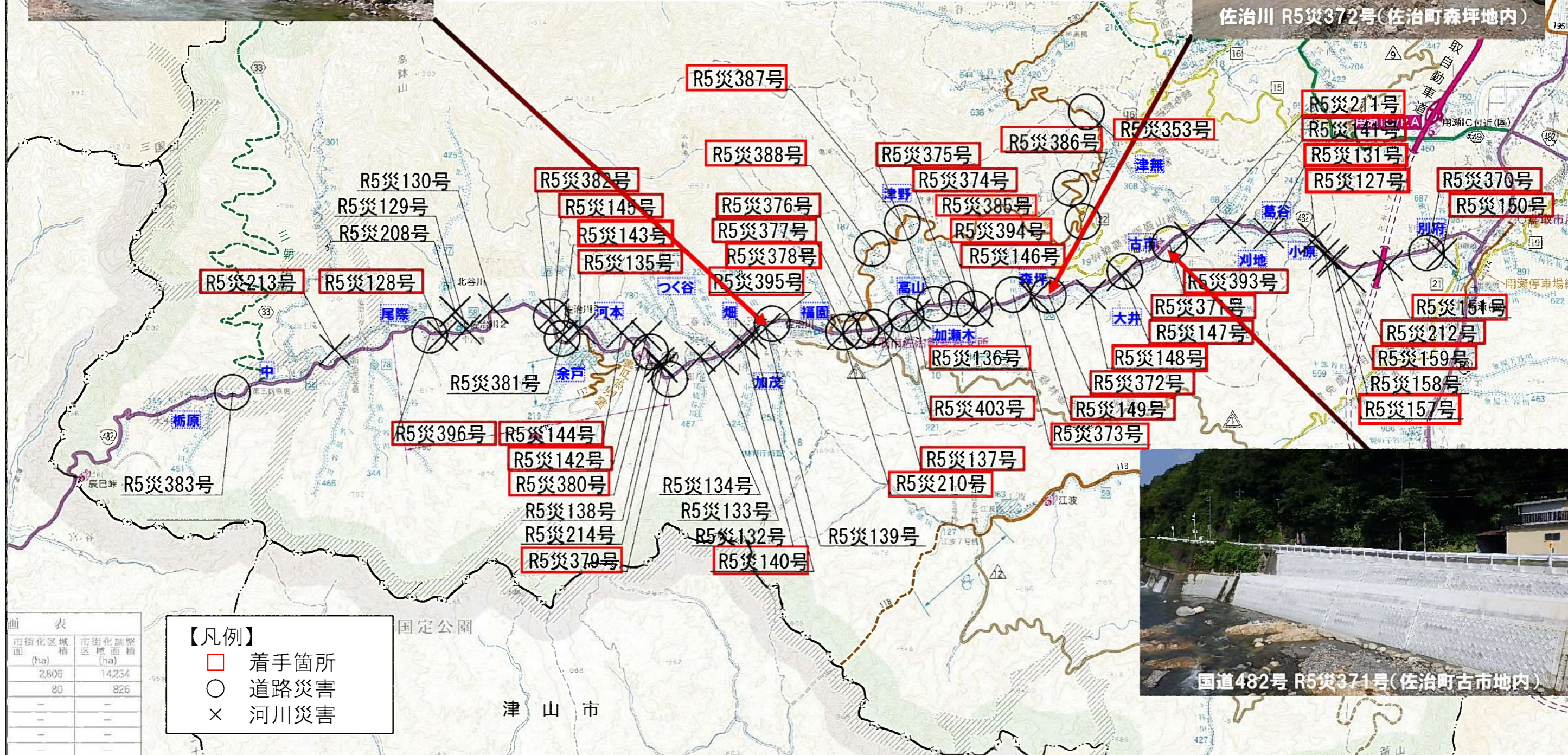
国道482号 R5災371号(佐治町古市地内)