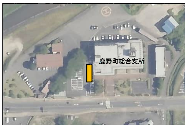
(7) 鹿野支所便【鹿野町総合支所】