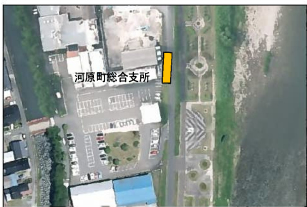
(3) 河原支所便【河原町総合支所】