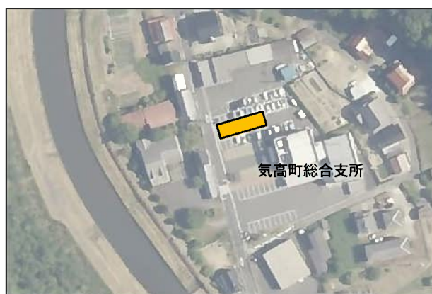
(6) 気高支所便【気高町総合支所】