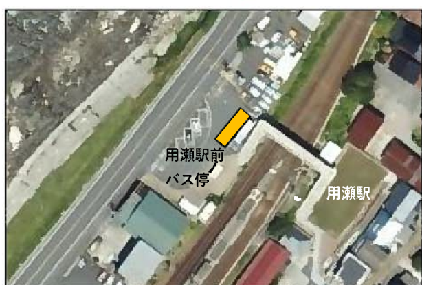
(4) 用瀬支所便【JR用瀬駅前バス停】