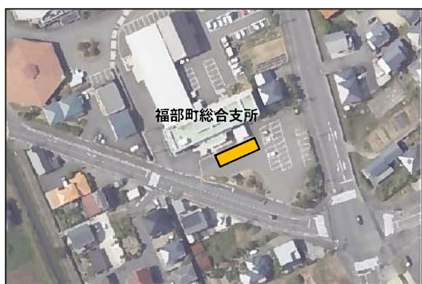
(2) 福部支所便【福部町総合支所】