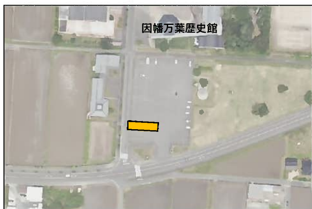
(1) 国府支所便【因幡万葉歴史館】