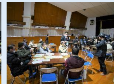
↑（3/10 災害に強い地域を考える集いの様子