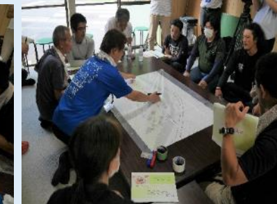
↑（7/28 防災研修会の実施の様子）