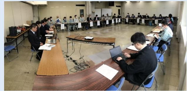
↑（有識者を交えた検討会議の様子）