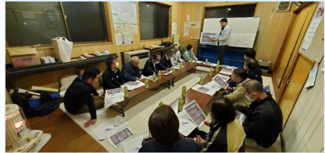
↑（佐治町対象地域での説明会の様子）

○11月17日～12月9日の間、佐治川ダム下流部の浸水想定区域に関係する地区（8集落）を対象に、当時の気象、ダム操作、洪水状況等を説明、課題等の協議を実施。