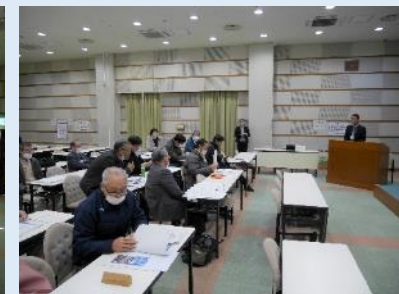
↑（2/28 先進地視察の様子（岡山県高梁市）