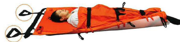
エアーストレッチャー

⇒階段の昇降が難しい避難者の方の垂直避難を支援するためのエアーストレッチャーや女性避難者が手に取りやすいサニタリーセットの導入