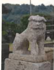
狛犬うん形 1801年 花崗岩製

もとは「湊八幡宮」と称して、江戸時代は芦崎川（勝部川河口）西岸側にある丸山に鎮座していた。祭神は、品陀和氣命と武内宿禰。明治4年（1871）に現在地の八軒屋に移り、同5年芦崎村の村社となっている。