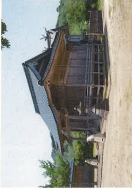
湊神社（もと湊八幡宮）