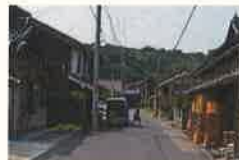
山崎醸造本舗 明治期に麴製造で創業 現在、麴、味噌、 醤油を製造 銘柄「イナサ醤油」