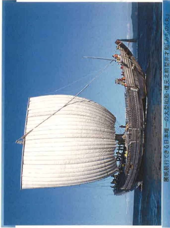
展覧航行できる日本唯一の大型和船「復元北前型井才船「みちのく丸」