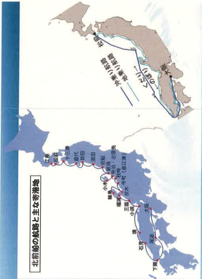
北前船の航路と主な寄港地

- 大阪と北海道を、日本海回りで商品を売り買いしながら往復した船(回船)。もともと、瀬戸内や大阪の人たちが、北にある日本海を回って来る回船のことを北前船と呼んだ、といわれる。