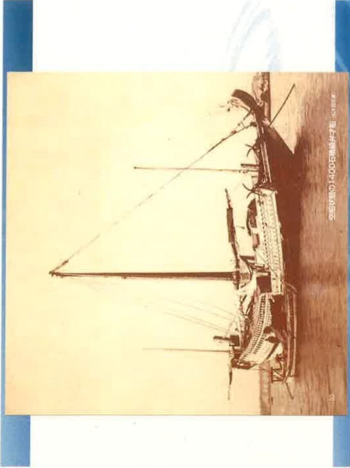
2500年物の「400石船」井才船 | © 1998