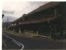
西本酒造場 銘柄「美人長」 家屋は明治期築 酒蔵は江戸末期築