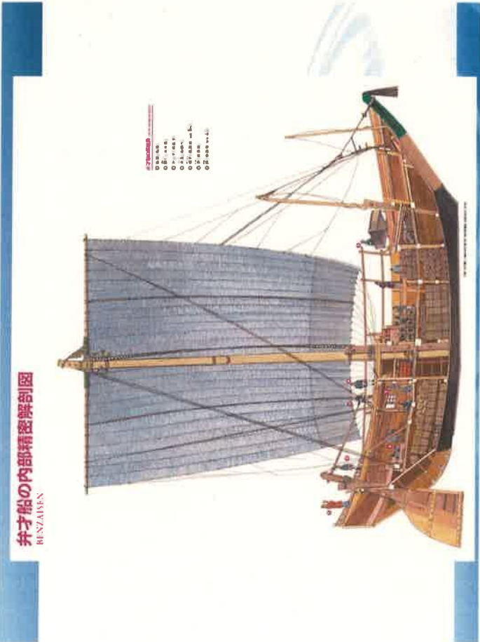
井才船の内部精密解剖図 BENZAIKEN