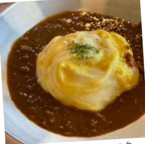
コーヒー&カレー五島 ホタテ発掘カレー