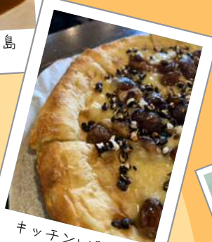
キッチンいただき やよいピザ