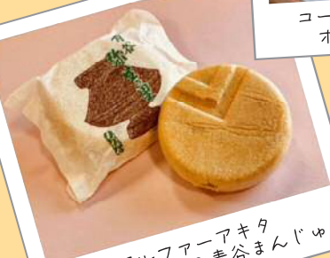
アルファアキタ 弥生の里もなか&青谷まんじゅう