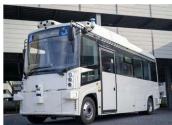
運行予定の車両