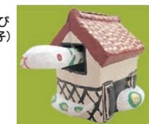
長者へび(六原張子)

日からでたへび 十二支の郷土玩具 とき 2月18日(火)まで 観覧料 無料 ※要入館料